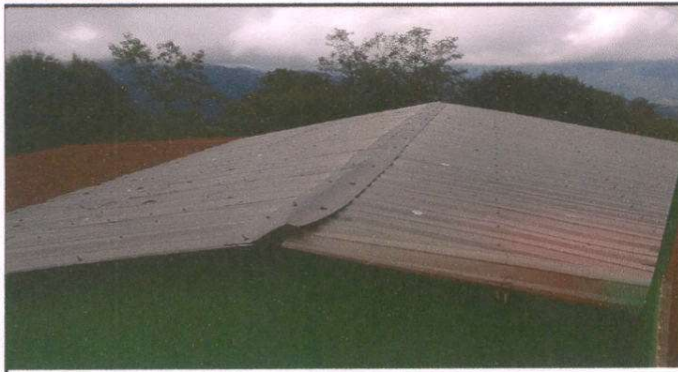
Foto1: Sustrucción de lámina, por lámina troquelada, 88 M2 . Sustrucción de capote de lamina para lamina troquelada 4 ML