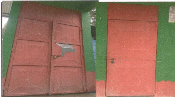
Foto 3 Mantenimiento a estructura (lijado, cambio de tubo , cepillado, sujeciones, aplicación de pintura) 4 unidades.