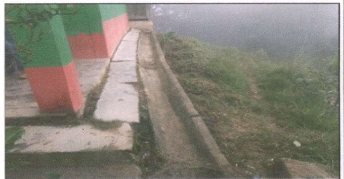
Foto 6 Reparación de banquetas de concreto y cunetas 16 M2

Observación: Si es necesario se pueden agregar hojas adicionales y actualizar el número de hojas.