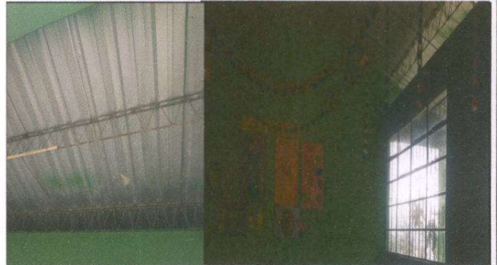
Foto 2: Sustrucción de estructura de soporte de madera, por metal, 90ML